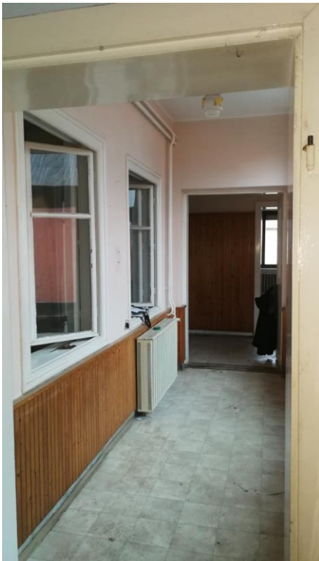
A tornác helye