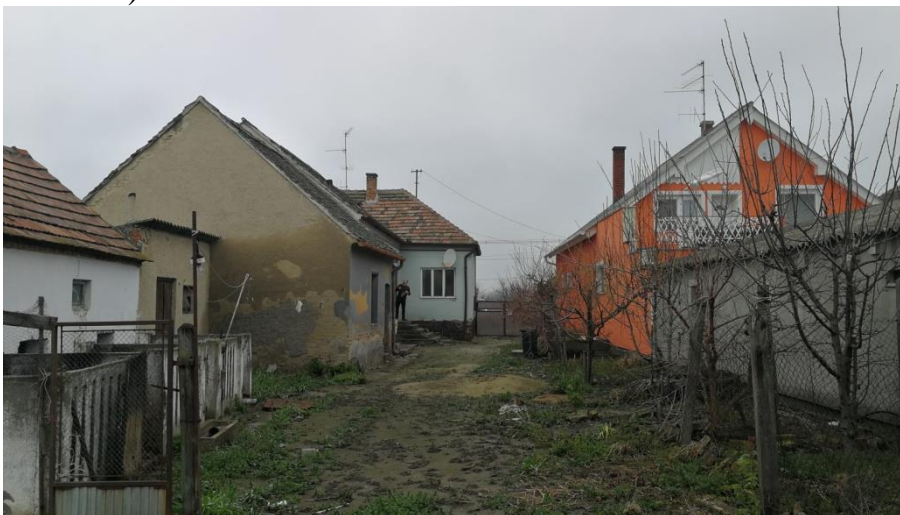
Mai állapot, udvari

Az épület értékeit tartalmazó értékleltár, amelyeket az építés során meg kell tartani: - A XIX. századi épület helye, és a megtalált és felhasználható épületrészek. - A XIX. századi épület szélességi méretei a tornác jelölésével (annak csak a helye biztos).