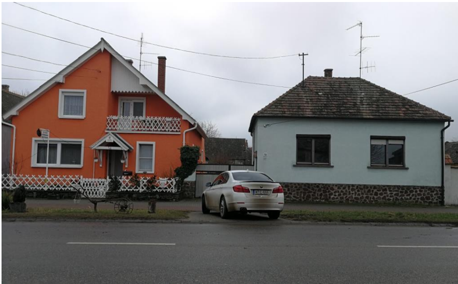
Mai állapot utcai;

tek analizálása során összevetve a kataszteri térképi állapotokkal arra a következtetésre jutottunk, hogy a területen korábban meglévő lakóépület egy klasszikus fertő-parti parasztház lehetett a szomszédjaiban (Hrsz: 232, 230/2) ma is eredeti állapotában látható oldal tornácos kialakítással. Az épület teherhordó falazatai régi nagyméretű tömör téglából készültek egyedi falazási módszerrel. (egy sor kötő – 30 cm vtg + 1 sor álló kantni – 8 cm vtg váltó kötések falazással) Az építés kora 1860 körüli időkre datálható.”